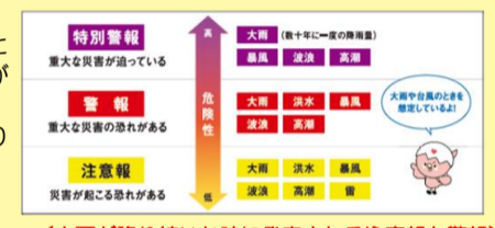
(大雨が降り続いた時に発表される注意報と警報)

昨今の異常気象、台風や地震等の自然現象に対して、「命を守る行動」がキーワードとなっております。「命を守る行動」とは避難指示が出たから避難所へ必ず行くのではなく、家にいた方が安全な場合は家にいるなど自ら 考え行動する ということ。しかし、実際にそのような場面に直面すると正しい判断というのは難しいと思います。今月号より正しい知識を身に付け、いざという時に正しい判断ができるようにクイズ形式で出していきたいと思っております。全部で14問ありますが、今回はその中から以下の3問を出題します。残りの問題が気になった方は、「 広島FM 防災ドリル 」で検索してください。より詳しい解説と防災に役立つ豆知識などが掲載されております。